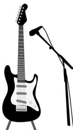
Ģitārists - dziedātājs